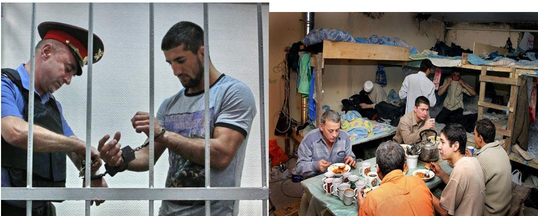
Рис. 2. Образы неработающих и антисоциальных мигрантов

Наибольшая социальная дистанция была выявлена с образами неработающих и антисоциальных мигрантов. Респонденты считают, что такие лица не должны пускаться в РФ (рис. 2).