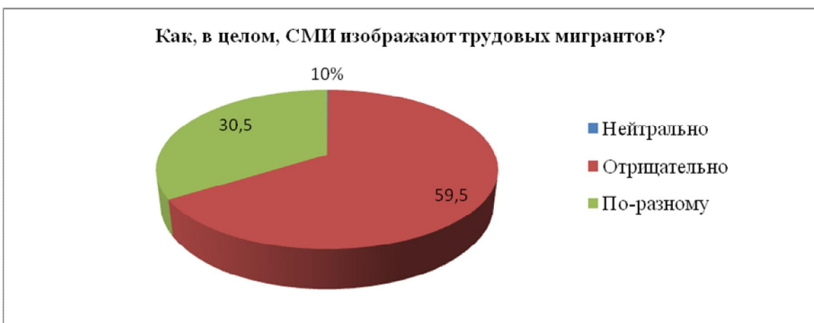
Рис. 4. Роль СМИ в формировании образа мигранта

Большинство респондентов (59,5%) считает, что в целом СМИ изображает трудовых мигрантов в негативном свете (преступниками, необразованными людьми, «чужаками» приехавшими отнимать исконно русские земли) (рис. 4).