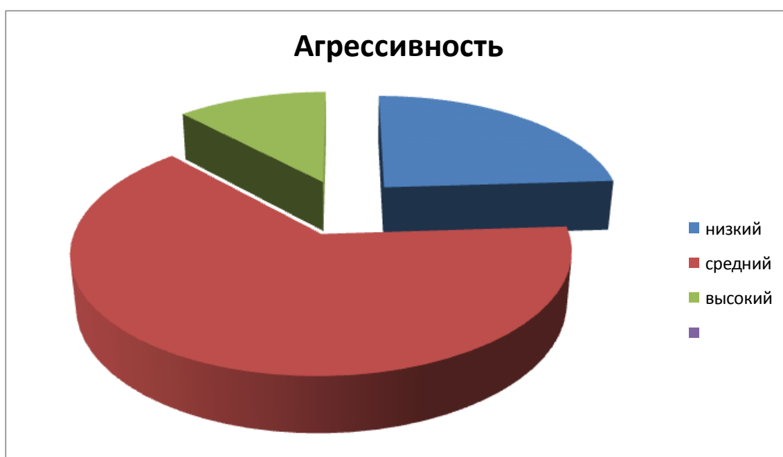
Рисунок 1. Результаты исследования респондентов на агрессивность

По результатам теста на агрессивность можно наблюдать такие данные на следующем рисунке: